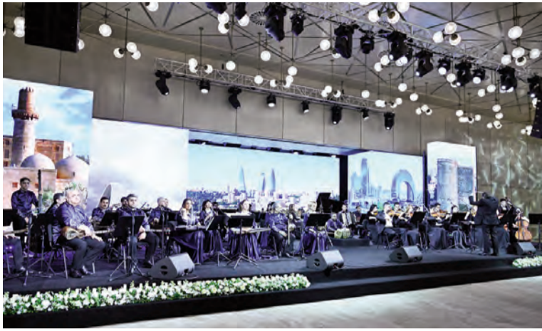
(Əvvəli 2-ci səhifədə)

Cənab Baş nazir ötən il və 2023-cü ildə ölkəmizə səfər edib. Mən isə ötən il Pakistanda dövlət səfərində olmuşam. Bu gün əziz qardaşım Azərbaycana dövlət səfərinə gəlib.