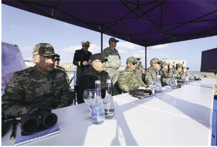
Azərbaycan Respublikasının müdafiə naziri general-polkovnik Zakir Həsənov,