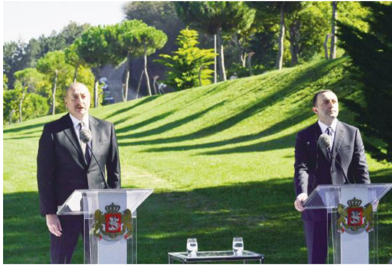
(Əvvəli 2-ci səhifədə)

Energetika sahəsində ənənəvi sahələrdən başqa bu gün bizi birləşdirən "Yaşıl enerji dəhlizi" layihəsidir. Burada da biz - yenə də Gürcüstan və Azərbaycan - iki qardaş ölkə Avropa ölkələri ilə sıx əməkdaşlıq edirik və yaxın aylarda bu layihənin texniki-iqtisadi əsaslandırması hazır olacaq. Öminəm ki, ondan sonra biz konkret işlərə start verə bilərik.