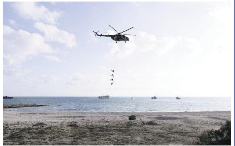
Sonda təlimdə fərqlənən bir qrup hərbi qulluqçuya qiymətli hədiyyələr təqdim edilib. Qeyd edək ki, "Xəzri-2023"

Müdafiə nazirləri ümumilikdə təlimin gedişatını və hərbi qulluqçuların peşəkarlığını yüksək qiymətləndiriblər.