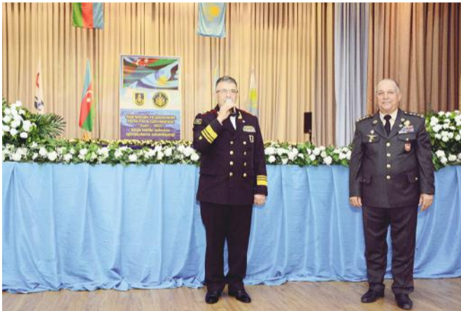
rində müvəffəqiyyətlər arzulanıb.

Müdafiə Nazirliyi Mətbuat Xidməti xəbər verir ki, Azərbaycan və Qazaxıstan respublikalarının suverenliyi və ərazi büt