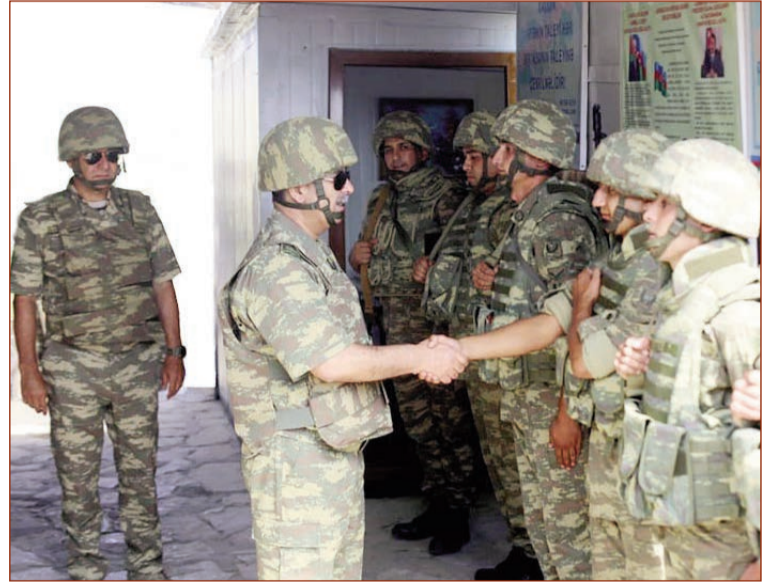
Müdafiə naziri bölmələrdəki şəraitlə tanış olub, şəxsi heyətlə çay süfrəsi arxasında söhbət aparıb.

Müdafiə Nazirliyinin rəhbərliyi bölmələrin döyüş qabiliyyətini, maddi-texniki təminatını, silah-sursat və hərbi texnika ilə təchizatını, həmçinin şəxsi heyətin mənəvi-psixoloji hazırlığını yüksək qiymətləndirib.