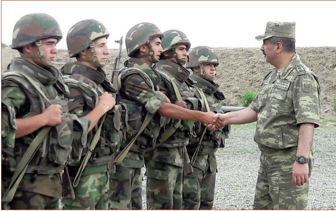
Aprəl ayının ilk günlərində təmas xəttində Ermənistan ordusu kontingentinin törətdiyi

Cəbhə bölgəsində yerləşən hərbi hissələrdə olarkən səngərlərə baş çəkən ordu rəhbərliyi döyüş növbətçiliyinin təşkili ilə bilavasitə yerində tanış olub, eyni zamanda bayram günlərində düşmənlə üzbəüz postlara gedərək Vətənimizin müdafiəsində dayanmış cəsur Azərbaycan oğullarının əhval-ruhiyyəsilə maraqlanıb və onları müqəddəs Ramazan bayramı münasibəti ilə səmimi təbrik edib. Müdafiə naziri general-polkovnik Zakir Həsənovun və Baş Qərargah rəisi general-polkovnik Nəcməddin Sadıkovun bilavasitə təmas xəttində