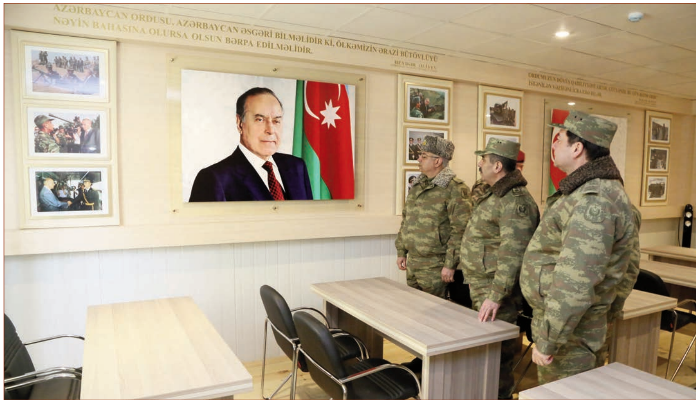
(Əvvəlki 1-ci səhifədə)

Cəbhə bölgəsində yeni tikilən daha bir hissə istifadəyə verilib