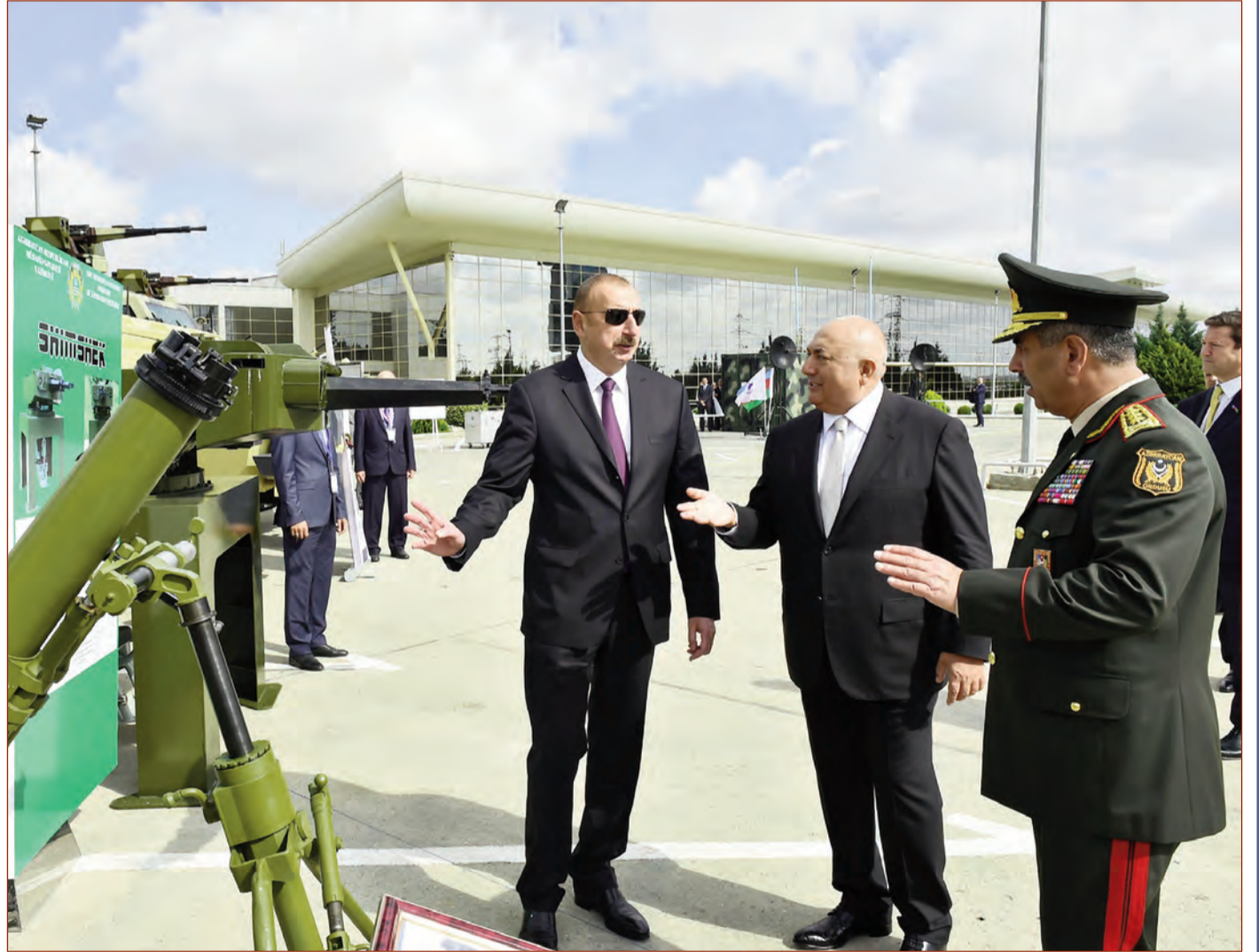
Azərbaycan Respublikasının Prezidenti İlham Əliyev sentyabrın 25-də Bakı Ekspo Mərkəzində açılan "ADEX-2018" Üçüncü Azərbaycan Beynəlxalq müdafiə sərgisi ilə tanış olub.