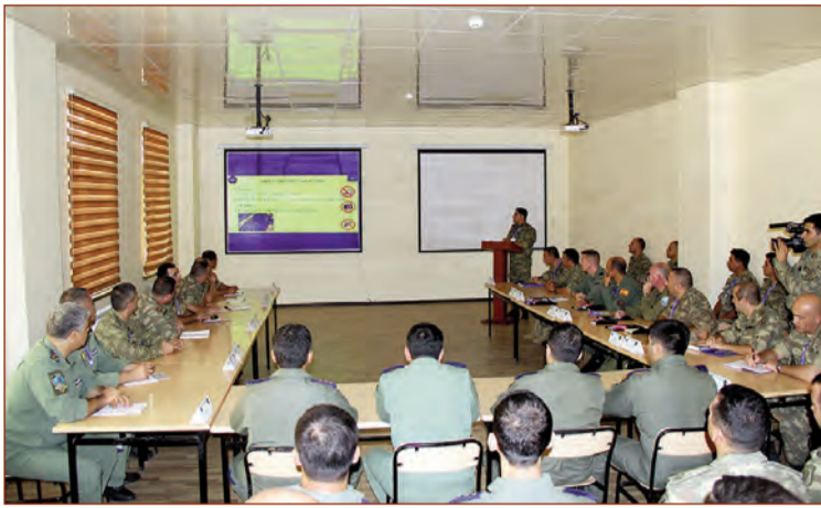
Bakıda NATO-nun Əməliyyat İmkanları Konsepsiyası (ƏİK) proqramı çərçivəsində Azərbaycan Ordusunun helikopter cütlüyünün birinci səviyyəli özünüqiymətləndirmə təlimi keçirilib.