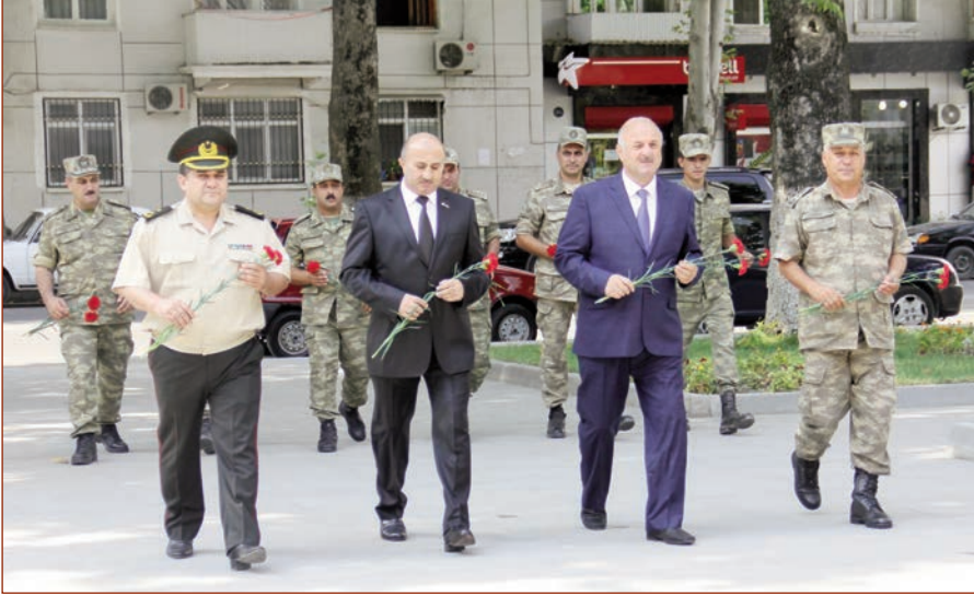
Azərbaycan Respublikası Müdafiə Nazirliyi və Mingəçevir şəhər İcra Hakimiyyətinin birgə təşkilatçılığı ilə "Ön səngərdən gələn var" adlı tədbir keçirilib.

Əvvəlcə xalqımızın ümummilli lideri Heydər Əliyevin abidəsi qarşısına gül dəstələri qoyulub. Şəhidlər xiyabanı ziyarət edilib.