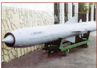
Gəmiəleyhinə Yaxont raket

Gəmiəleyhinə qanadlı "Yaxont" raketini güclü atəş və radioelektron qarşudurmalar zamanı suüstü hərbi-dəniz qruplaşmalarına qarşı mübarizə aparmaq üçün istehsal edilib. Gəmiəleyhinə kompleksin yaradılmasına 70-ci illərin sonunda və 80-ci illərin əvvəllərində başlanılıb. İlk olaraq bu kompleksin su-