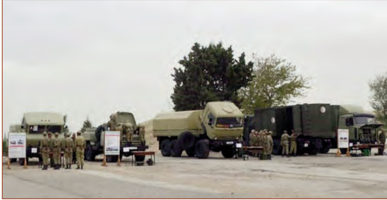
Müdafiə Nazirliyi Mətbuat Xidmətinin məlumatına əsasən, silah və texnikanın qış dövründə fasiləsiz və dayanıqlı

Azərbaycan Ordusunun bütün hərbi hissə və bölmələrində silah, döyüş və xüsusi texnikanın istismarının qış mövsümünə keçirilməsi prosesi aparılır.