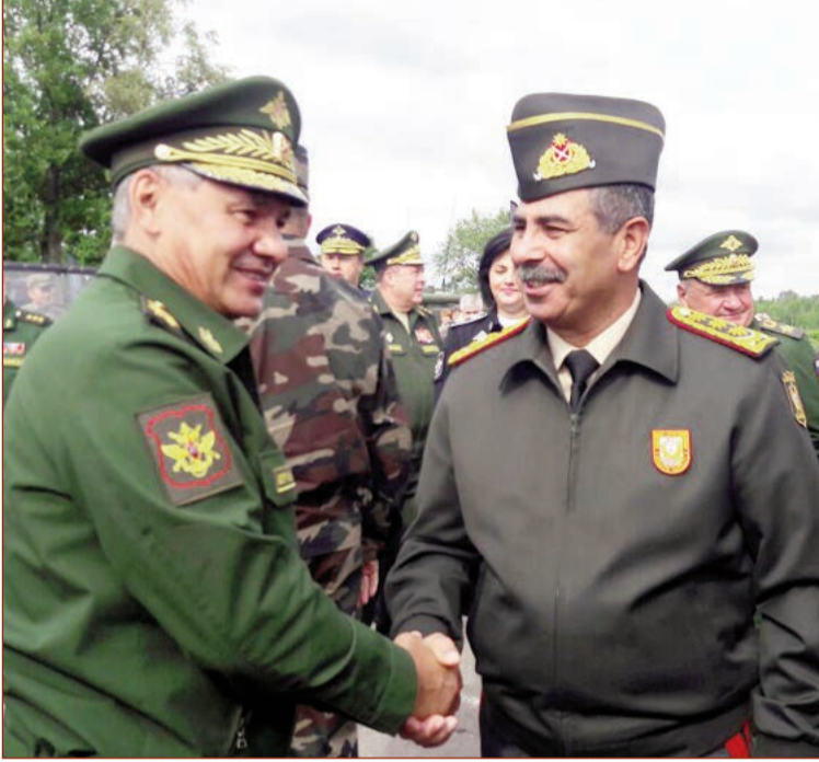
Moskva şəhərində işğuzar səfərdə olan Müdafiə naziri general-polkovnik Zakir Həsənov avqustun 13-də Alabino

poliqonunda təşkil edilən "Beynəlxalq Ordu Oyunları - 2016" yarışlarının tənənəli bağlanış mərasimində iştirak edib.