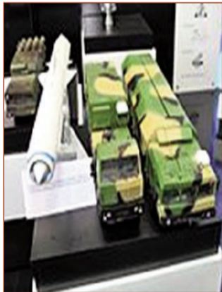
"Bastion" sahil raket kompleksi

Hazırladı: Svetlana YUSUBOVA, "Azərbaycan Ordusu"