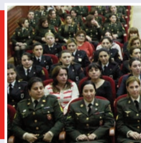
Azərbaycan qadını yüksək hörmət və ehtirama layiqdir

General-polkovnik Zakir HƏSƏNOV Azərbaycan Respublikasının Müdafiə naziri