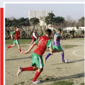
Qəhrəmanlar heç zaman unudulmurlar