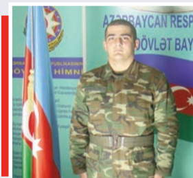
Vətəni qorumaq borcumuzdur