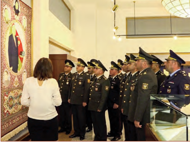
fəri zamanı muzeyə gələrək buradakı ekspozisiya ilə tanış olub. Ulu Öndərin muzeyi ziyarəti zamanı çə-

Ulu öndər Heydər Əliyevin Naxçıvan şəhərinin baş meydanında əzəmətlə ucaldan abidəsi önünə tər gül dəstələri qoyan zabitlər Heydər Əliyev Muzeyinə gəliblər. Burada bildirilib ki, ümummilli lider Heydər Əliyev 1999-cu il oktyabrın 13-də muxtar respublikaya sə-