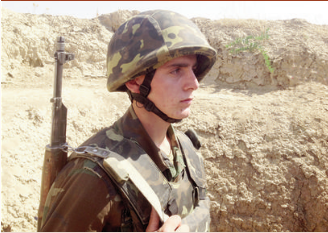
(Əvvəlki 3-cü səhifədə)

Budur, artıq saat 13:40-ı göstərir. Hərbi maşınlar tozlu-torpaqlı yollardan keçərək Xocavənd istiqamətində düşmənlə təmas xəttinə doğru irəliləyir.