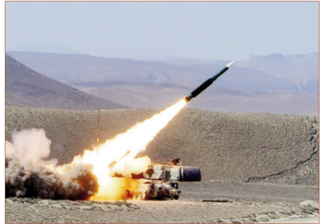
Avqustun 14-də Hərbi Hava Qüvvələri hava hücumundan müdafiə qoşunlarının "Buk-MB" zenit-raket komplekslərindən istifadə olunmaqla təlimləri davam edib.

Müdafiə naziri general-polkovnik Zakir Həsənovun bilavasitə rəhbərliyi ilə keçirilən təlimlərin əsas məqsədi şəxsi heyət tərəfindən döyüş