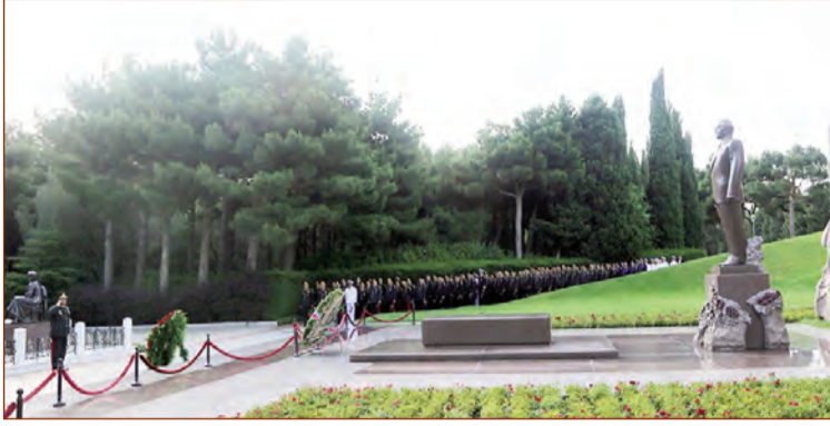
İyunun 25-də Müdafiə Nazirliyinin rəhbərliyi və şəxsi heyəti Silahlı Qüvvələr Günü münasibətilə Fəxri xiyabanı və Şəhidlər xiyabanını ziyarət ediblər.

Müdafiə Nazirliyi Mətbuat Xidmətinin məlumatına əsasən, əvvəlcə xalqımızın ümummilli lideri Heydər Əliyevin abidəsi önünə əklil qoyulub, xatirəsi hörmət və ehtiramla yad edilib.