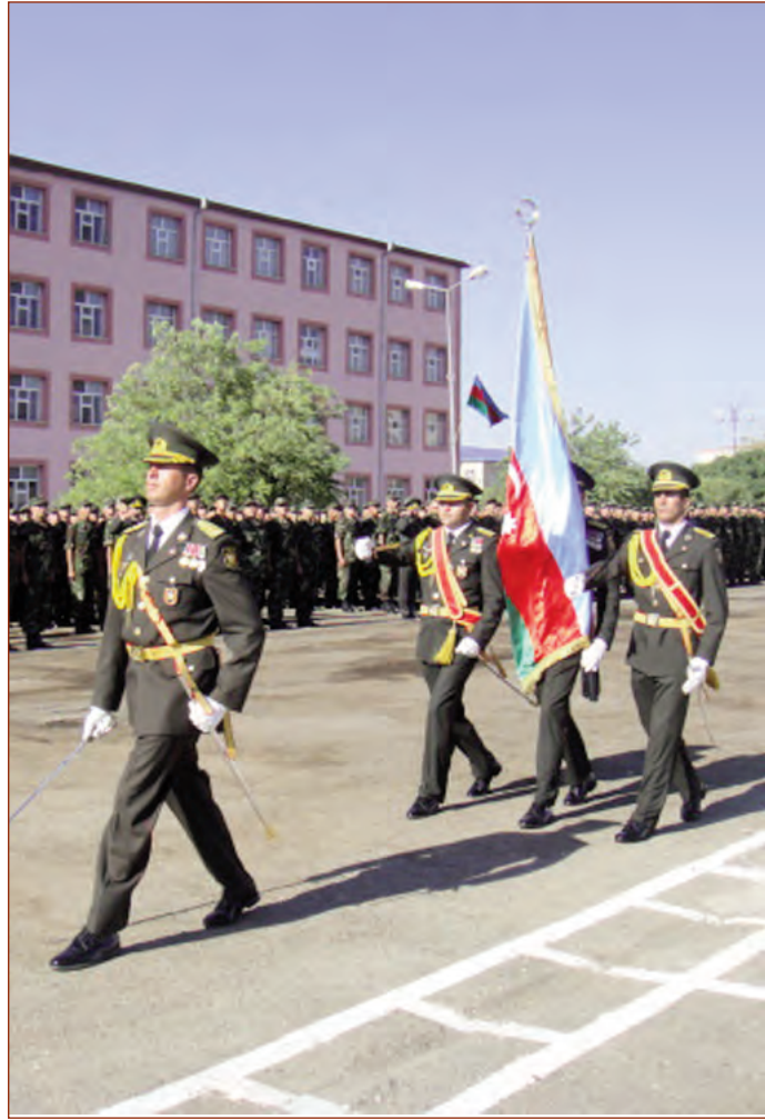
Əlahiddə Ümumqoşun Orduda da iyul ayı ərzində həqiqi hərbi xidmətə çağırılmış əsgərlər hərbi andı qəbul ediblər. İlk olaraq mərasimə hərbi hissənin döyüş bayrağı gətirilib. Azərbaycan Respublikasının Dövlət himni səsləndirilib və hərbi andıçmə mərasimi açıq elan edilib.

Müdafiə Nazirliyinin hərbi hissə və birləşmələrində təntənəli andıçmə mərasimi keçirilib