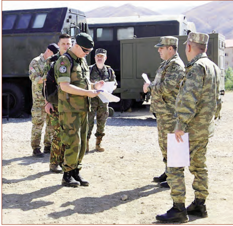
Müdafiə Nazirliyi Mətbuat Xidmətinin məlumatına əsasən, Naxçıvan Muxtar Respublikasında növbəti dəfə beynəlxalq silahlara nəzarət inspeksiyası keçirilib.

Norveç Krallığının rəhbərlik etdiyi və tərkibində Danimarka, Lüksemburq, Niderland, İspaniya və ABŞ-dan olan nümayəndələrin də yer aldığı 9 nəfərdən ibarət beynəlxalq inspeksiya qrupu tərəfindən Əlahiddə Ümumqoşun Orduda "Elan olunmuş yer" in inspeksiyası və qiymətləndirməsi aparılıb.