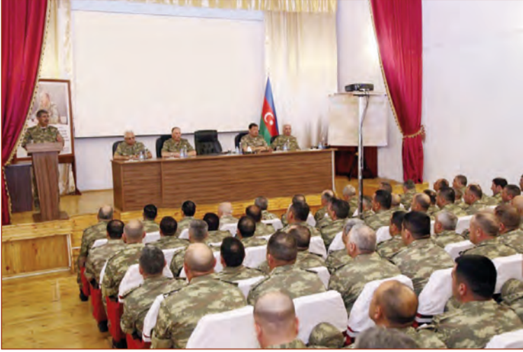
(Əvvəli 1-ci səhifədə)

Bütün bunlar silahlı münaqişədə zəfər üçün zəruridir və buna görə də uğurlu təlimlər hərbi əməliyyatların başlanması və keçirilməsinin əsl qabiliyyətini göstərir.