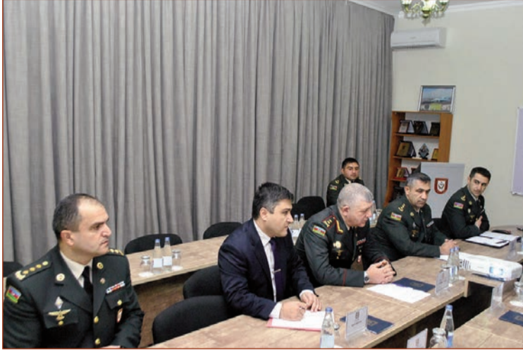
Noyabrın 22-də Birləşmiş Ərəb Əmirlikləri (BƏƏ) Milli Müdafiə Kollecinin nümayəndə heyətinin rəhbəri briqada

generalı Salim Əl-Şamsi Azərbaycan Respublikası Silahlı Qüvvələrinin Hərbi Akademiyasında olub.