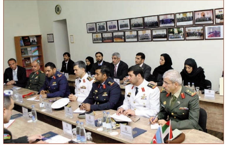
Sonda briqada generalı Silahlı Qüvvələrin Hərbi Akademiyasının xatirə kitabına ürek sözlerini yazıb.

Qonaqlara "Azərbaycan Respublikası Silahlı Qüvvələrinin Hərbi Akademiyası", "Müdafiə Nazirliyinin Beynəlxalq Hərbi Əməkdaşlıq fəaliyyəti" və "Azərbaycan Respublikasının müdafiə və təhlükəsizlik siyasəti, onun prioritetləri" haqqında brifinqlər təqdim olunub.