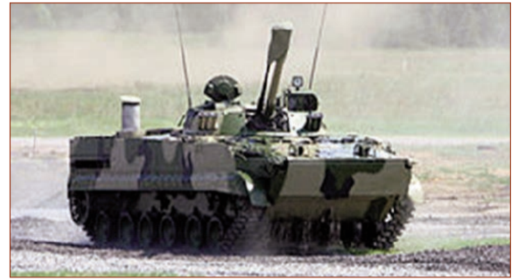
PDM-3 (piyadaların döyüş maşını)

PDM-3 (piyadaların döyüş maşını) Rusiya istehsalı olan zirehli, tırtılı maşındır. Çəkisi 18,7 tondur. Heyəti üç nəfərdən ibarətdir, maşına beş nəfər desant və əlavə iki nəfər də yerləşdirilə bilər. Sürəti şose yolda saatda 70 kilometr təşkil edir. Maşın gündüz və gecə, uzaqözlü lazerli nişangahlarla təchiz edilib.