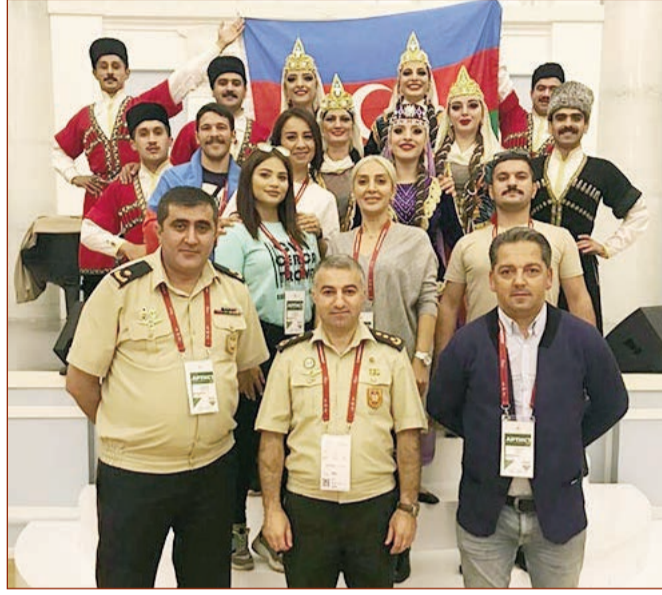
səs" vokal nominasiyası üzrə birinci, "Rəqs ritmləri" nominasiyası üzrə ikinci yerə layiq görülüb.

Festivalda uğurla çıxış edən Həzi Aslanov adına Ordu İdeoloji və Mədəniyyət Mərkəzinin Mahni və Rəqs Ansamblı "Qızıl