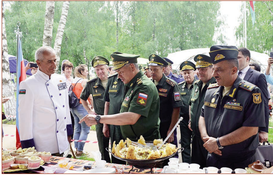
Müsabiqə çərçivəsində Azərbaycanın milli mədəniyyətini əks etdirən sənət nümunələri və musiqi alətləri də nümayiş etdirilib.

Müdafiə Nazirliyi Mətbuat Xidmətinin məlumatına əsasən, Azərbaycan, Rusiya, Belarus, Serbiya, Monqolustan və İsrailin hərbi aşpazları yarışların iştirakçıları və qonaqlar üçün milli mətbəxlərinə aid 150-dən çox yeməklər hazırlayıblar. Müsabiqəni izləyən çoxsaylı qonaqlar hərbi aşpazlarımızın hazırladıkları xörəklər və şirniyyatların dadına baxıblar.