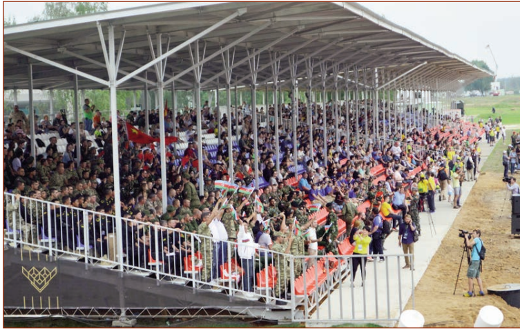
Beynəlxalq Ordu Oyunları "Fərdi sürmə" müsabiqəsinin "Tank biatlonu" mərhələsinə start verilib.