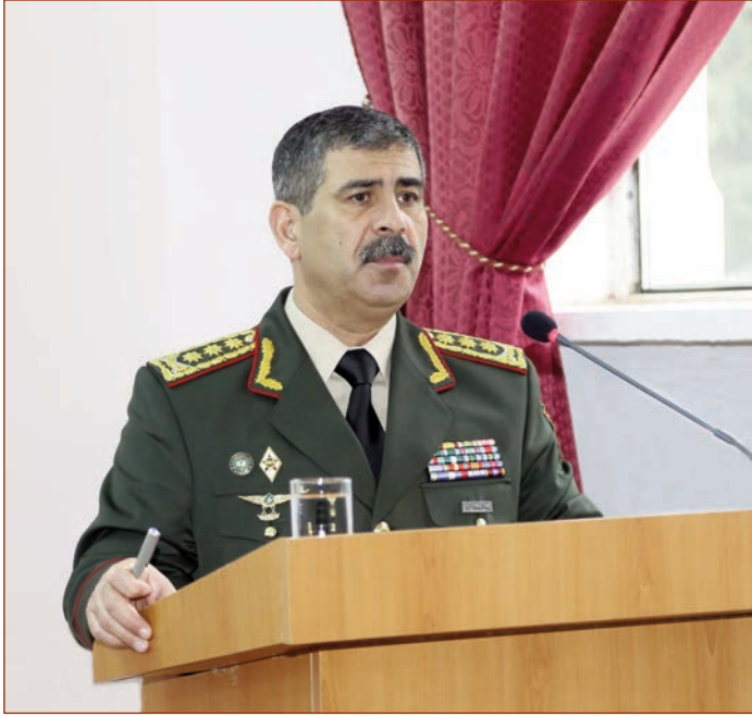
(Əvvəlki 1-ci səhifədə)

Hərbi səhiyyəmin inkişafında qazanılan əhəmiyyətli uğurlar, nümunəvi tibbi xidmətin təşkili məqsədlə həyata keçirilən islahatlar və hərbi tibb müəssisələrinin maddi-texniki təminatının gücləndirilməsi bu sahəyə göstərilən yüksək dövlət qayğısının bariz nümunəsidir. - deyərək nazir öz çıxışında qeyd edib. - Burada idarə rəisinin məruzəsi dinlənildi, ötən ildə hərbi təbabətdə qazanılan əhəmiyyətli uğurlar vurğulandı. Bütün bu deyilənlər məni hədsiz sevindirir, hazırda ölkəmizin səhiyyə sistemində önəmli yerlərdən birini hərbi təbabət təşkil edir. Artıq ən mürəkkəb ürək əməliyyatları hərbi hospitalımızda uğurla həyata keçirilir. Mən qürur hissi duyuram ki, hərbi həkimlərimizin sorğu inkişaf etmiş ölkələrdə eşidilir. Bu şöhrət dövlətimizə, xalqımıza və Silahlı Qüvvələrimizə başucalıdır.