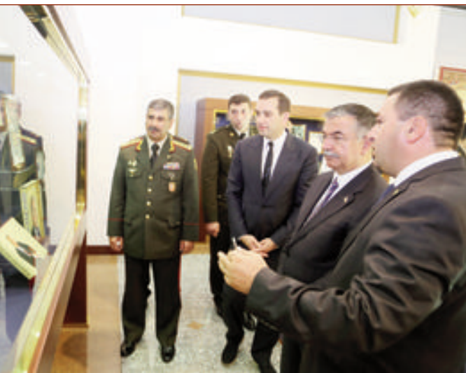
Avqustun 18-də Azərbaycan, Gürcüstan və Türkiyənin Müdafiə nazirləri general-polkovnik Zakir Həsənov, cənab İrakli Alasaniya və cənab İsmət Yılmaz Naxçıvan şəhərinin mərkəzində ucaldılmış Azərbaycan xalqının ümummilli lideri Heydər Əliyevin abidəsi önünə gül dəstələri qoyaraq Heydər Əliyev muzeyini ziyarət etdilər.

Qonaqlar Şəhidlər xiyabanında ölkəmizin müstəqilliyi, ərazi bütövlüyü uğrunda şəhid olmuş vətəndaşlarımızın məzarlarını ziyarət edərək gül dəstələri qoyublar. Sonra qonaqlar "Əshabi-Kəhf" ziyarətgahında olublar. Müdafiə nazirlərinin Naxçıvan şəhərinə səfəri avqustun 19-dək davam edib.