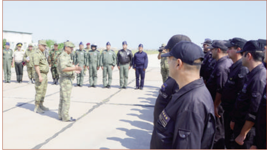
Müdafiə Nazirliyi Mətbuat Xidmətinin verdiyi məlumata görə, avqust ayının 13-də başlanmış təlimlərin keçirilməsində əsas məqsəd, şəxsi heyət tərəfindən döyüş tapşırığının düzgün yerinə yetirilməsinin müayyən edilməsi, hərəkdə olan qoşun qruplaşmalarının, mühüm hərbi və mülki obyektlərin hava zərbələrindən mühafizəsinin təşkil olunmasıdır.

Müdafiə naziri general-polkovnik Zakir Həsənovun rəhbərliyi ilə Hərbi Hava Qüvvələrinin təlimləri davam etdirilib