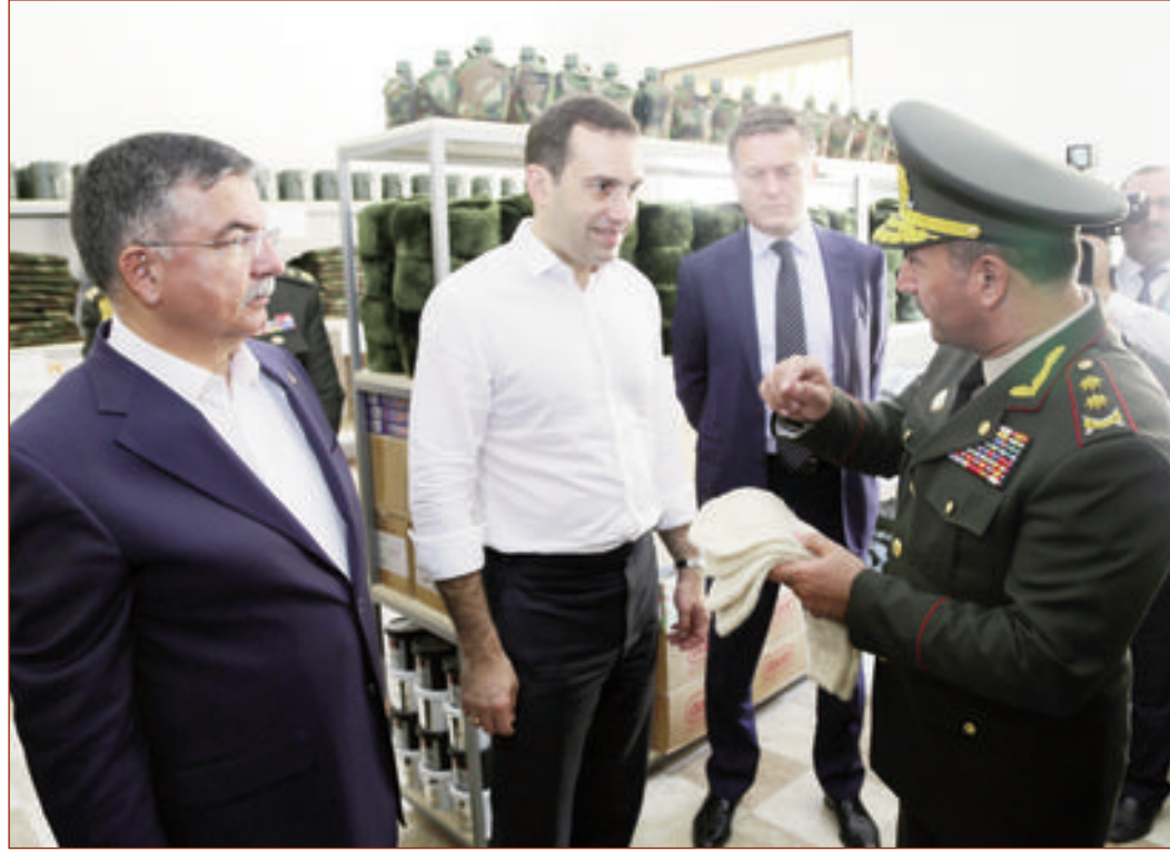
Sonra hər üç ölkənin Müdafiə naziri Əlahiddə Ümumqoşun Ordusunun "N" hərbi hissəsinə gedərək şəxsi heyət üçün yaradılmış şəraitlə tanış olublar. Bununla da Türkiyə Respublikası və Gürcüstanın Müdafiə nazirlərinin ölkəmizə rəsmi səfəri başa çatıb.