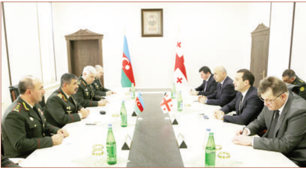
Avqustun 18-də Azərbaycan Respublikasının Müdafiə naziri general-polkovnik Zakir Həsənov ölkəmizə rəsmi səfərə gələn Gürcüstanın Müdafiə naziri cənab İrakli Alasaniyanı qəbul edib.

İ. Alasaniyanın rəhbərlik etdiyi nümayəndə heyətinin Naxçıvanda yerləşən Əlahiddə Ümumqoşun Ordusu