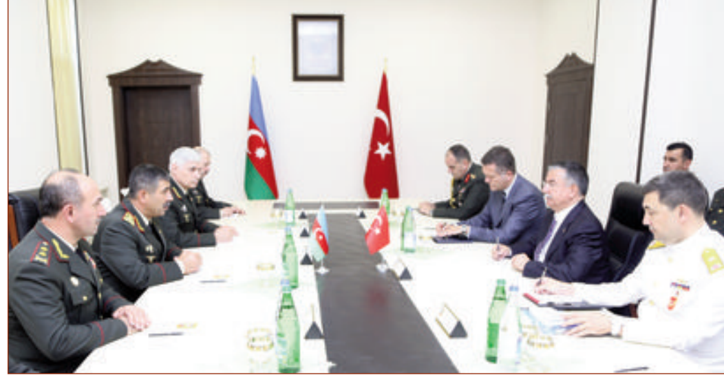
Avqustun 18-də Türkiyə Respublikasının Milli Müdafiə naziri cənab İsmət Yılmaz Azərbaycana rəsmi səfərə gəlib.

Qonağı Naxçıvan beynəlxalq hava limanında Azərbaycan Respublikasının Müdafiə naziri general-polkovnik Zakir Həsənov qarşılayıb.