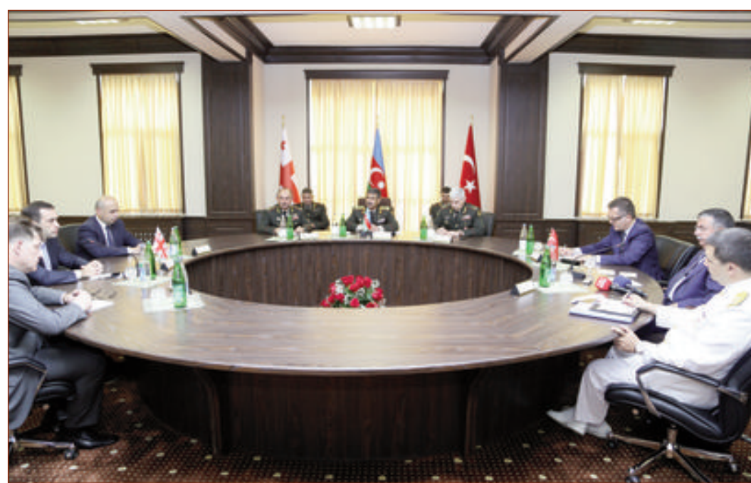
Avqustun 19-da Naxçıvan şəhərində Əlahiddə Ümumqoşun Ordusunun Qərargahında Azərbaycan Respublikasının Müdafiə naziri general-polkovnik Zakir Həsənov, Gürcüstanın Müdafiə naziri cənab İrakli Alasaniya və Türkiyə Respublikasının Milli Müdafiə naziri cənab İsmət Yılmaz arasında üçtərəfli formatda görüş keçirilib.

Görüşdə nazirlər regionda cərəyan edən hərbi-siyasi vəziyyət və təhlükəsizlik məsələləri ətrafında fikir mübadiləsi aparıb və hərbi sahədə əməkdaşlıq üzrə bir sıra qarşılıqlı maraq doğuran məsələləri müzakirə ediblər. Eyni zamanda qərar qəbul edilmişdir ki, Müdafiə nazirləri bu formatda hər altı aydan bir görüşsünlər. Danışıqlardan sonra kütləvi informasiya vasitələri nümayəndələri üçün brifinq keçirilib və Müdafiə nazirləri üçtərəfli görüşün yekunları barədə medianı məlumatlandırılıblar.