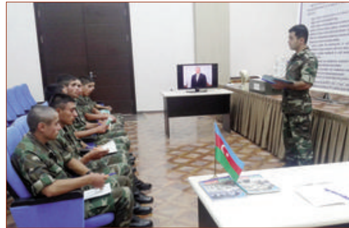
Məlum olduğu kimi, Müdafiə nazirinin müvafiq əmrinə uyğun olaraq Silahlı Qüvvələrimizdə "Ən yaxşı ictimai-siyasi hazırlıq qrupu" adı uğrunda müsabiqə keçirilib. Qəzetimizdən ötən saylarında bu barədə ətraflı məlumat vermişdik. Ordumuzun ayırı-ayrı qoşun növlərində və birliklərində artıq müsabiqəyə qatılmış qruplar içərisindən ən yaxşılara seçilib. Onlardan üç ən yaxşı qrup final müsabiqəsində iştirak etmək imkanı qazanıb. İlk üçlüyü tutan qruplar müsabiqənin qalibləri elan olunaçaqlar və onlar mükafatlandırılacaqlar.

Silahlı Qüvvələrdə keçirilən müsabiqədə "N" hərbi hissəsinin şəxsi heyəti fəal iştirak etdi