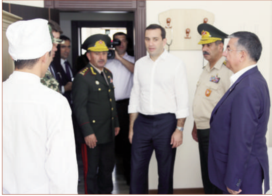
Avqustun 19-da Azərbaycan Respublikasının Müdafiə naziri general-polkovnik Zakir Həsənov, Gürcüstanın Müdafiə naziri cənab İrakli Alasaniya və Türkiyə Respublikasının Milli Müdafiə naziri cənab İsmet Yılmaz Naxçıvan qalasını, Nuh Peyğəmbərin məzarını, duz mağarasını, Möminə Xatun türbəsini, Xan Sarayını, Xalça Muzeyini ziyarət ediblər.