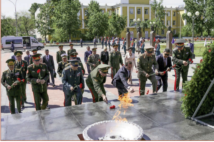
Müstəqil Dövlətlər Birliyi iştirakçı dövlətlərinin Müdafiə