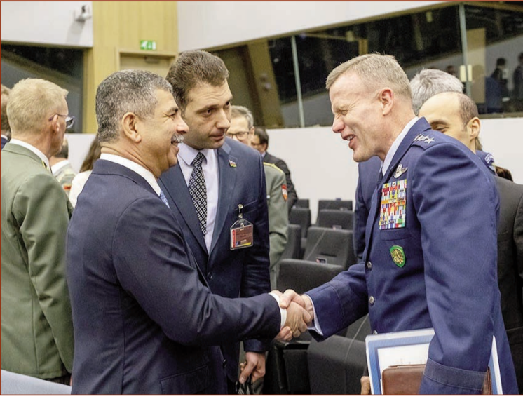
Azərbaycan Respublikasının Müdafiə naziri general-polkovnik Zakir Həsənov fevralın 13-də Brüssel şəhərində