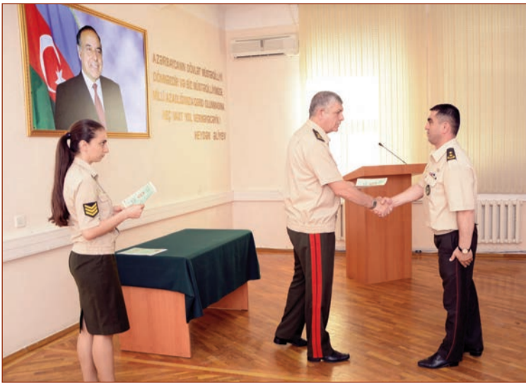
Müdafiə Nazirliyi Mətbuat Xidmətinin məlumatına əsasən, Silahlı Qüvvələrin Hərbi