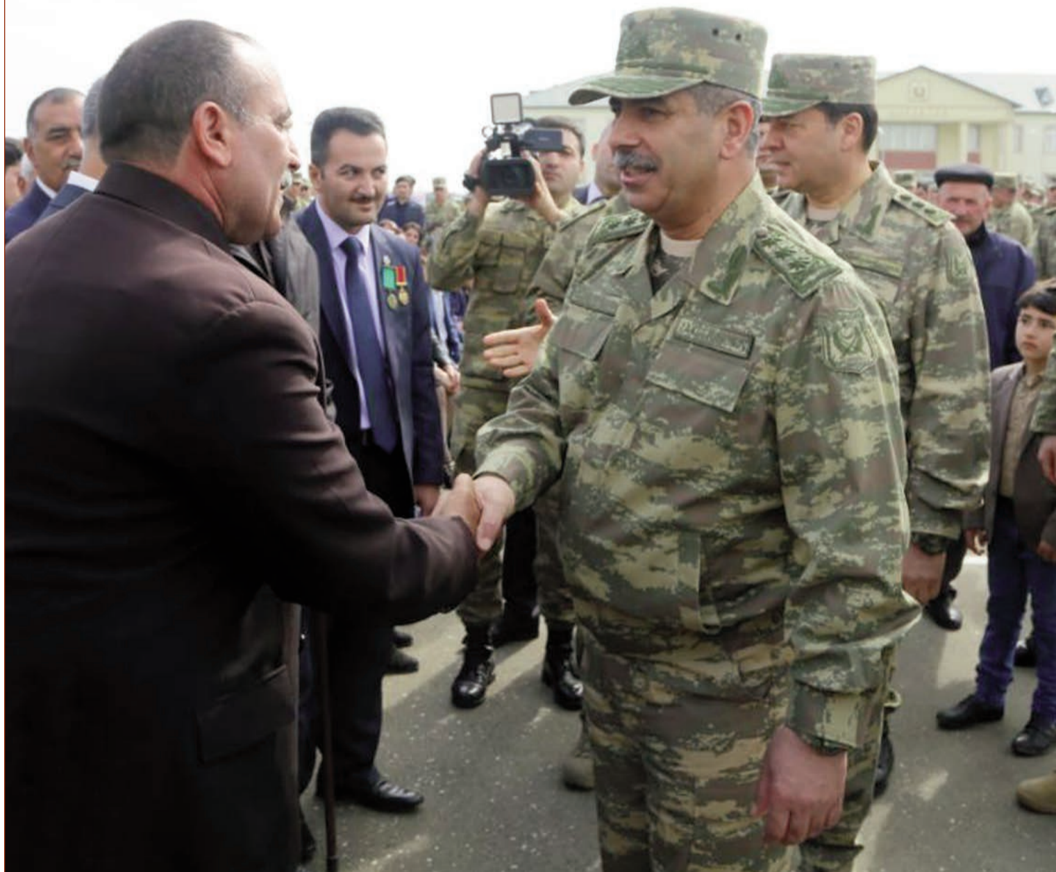
Silahlı Qüvvələrin Ali Baş Komandanı İlham Əliyevin göstərişinə əsasən, Novruz bayramı münasibətilə keçirilən "Açıq qapı" günündə Müdafiə Nazirliyinin rəhbər heyəti cəbhəboyu zonada yerləşən hərbi hissələrdə olub.

Xalqımızın səmimi münasibəti, mənəvi dəstəyi, hərbi vətənpərvərlik tədbirləri şəxsi heyətin döyüş ruhunun, qələbə əzminin daha da möhkəmlənməsinə yetərlidir. Əsgərlərimizə mənəvi dəstək olan hər kəsə dərin minnətdarlığımızı bildiririk.