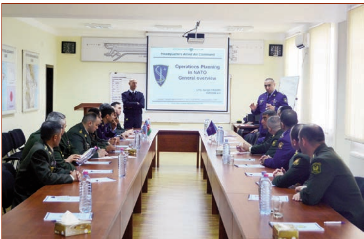
Azərbaycan Respublikası Müdafiə Nazirliyinin NATO ilə 2016-cı il üçün Fərdi Tərəfdaşlıq üzrə Əməkdaşlıq Proqramına əsasən, NATO-nun Ramştayn Hərbi Hava Qüvvələri (HHQ) Komandanlığının Mobil Təlim Qrupu tərəfindən "Birgə HHQ Əməliyyatlarının Planlaşdırılması" mövzusunda təlim kursu keçirilir.

Müdafiə Nazirliyi Mətbuat Xidmətinin məlumatına əsasən, kurs müddətində iştirakçılara "NATO HHQ-nin Komanda və Qüvvə strukturu", "Birgə Əməliyyatların Planlaşdırılmasının Əsas Xüsusiyyətləri" və digər mövzular barədə məlumatlar verəcək, eləcə də işçi qruplarda fəaliyyətlər həyata keçiriləcəkdir.