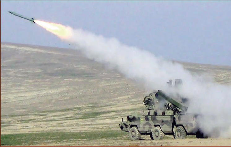
(Əvvəlki 1-ci səhifədə)

Müdafiə nazirinin təsdiq etdiyi 2019-cu il üçün döyüş ha-